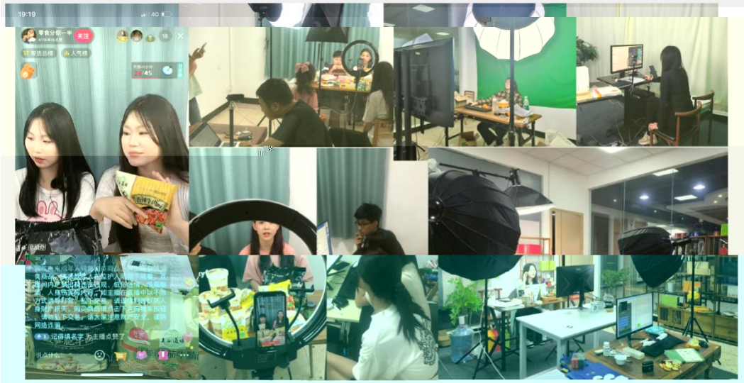
部份学员在进行电商直播实训现场