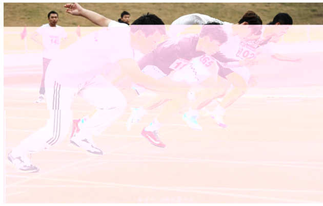
田径男子100米，是奥运会田径比赛的重要赛事之一。